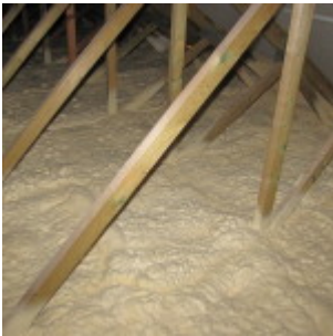
Zateplení stropu z půdy