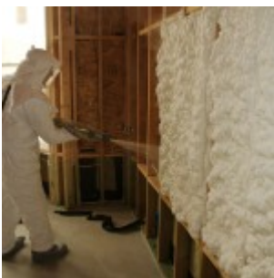
Nástřik stěny – příčky