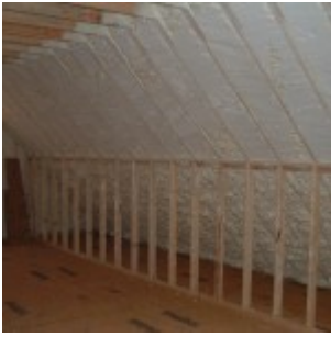
Hotová zaklopená podlaha