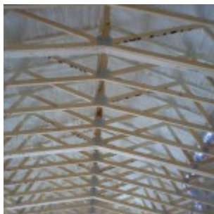
Nastřík stropu haly